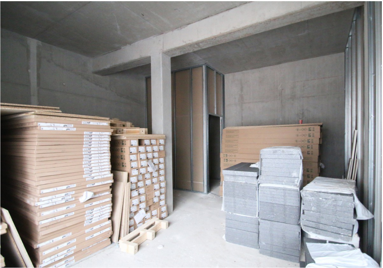
Ladenraum im Ausbau, hinten links WC-Raum