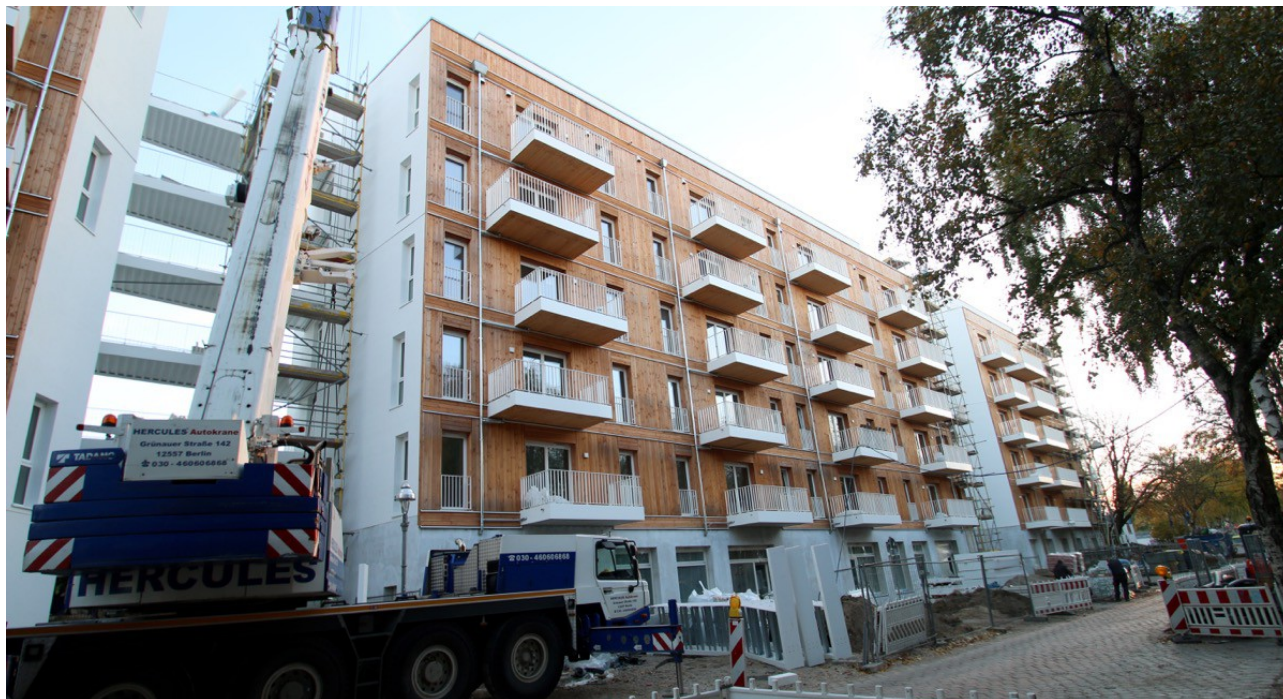
3-teiliger Neubaukomplex in der Lynarstraße (Häuser in Holzbauweise bis auf EG) „Wohnen und Werken im Wedding“, Bauprojekt der Wohnungsbaugenossenschaft „Am Ostseeplatz“ eG

zur Ausschreibung für einen Projektraum in der Lynarstr. 39, 13353 Berlin-Wedding, Größe gesamt: 37,81 m 2 , Mietbeginn: 01.01.2019