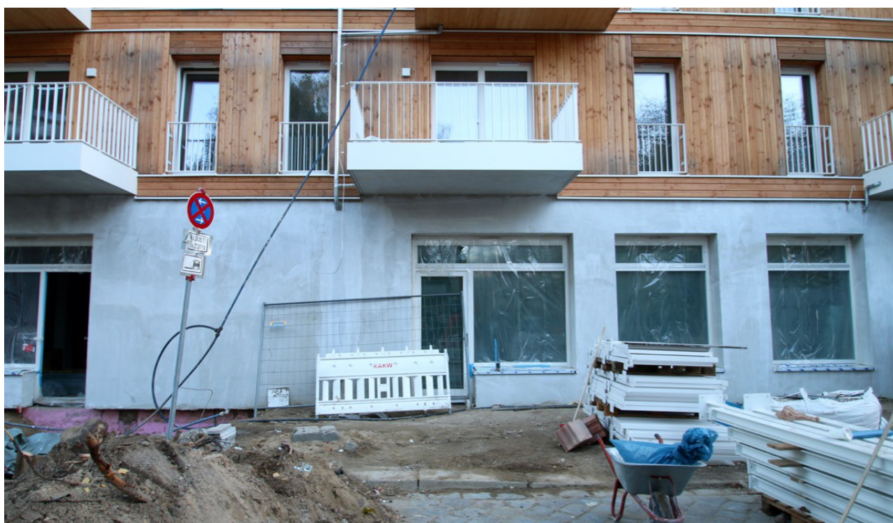
Ladenraum im EG (Mitte)