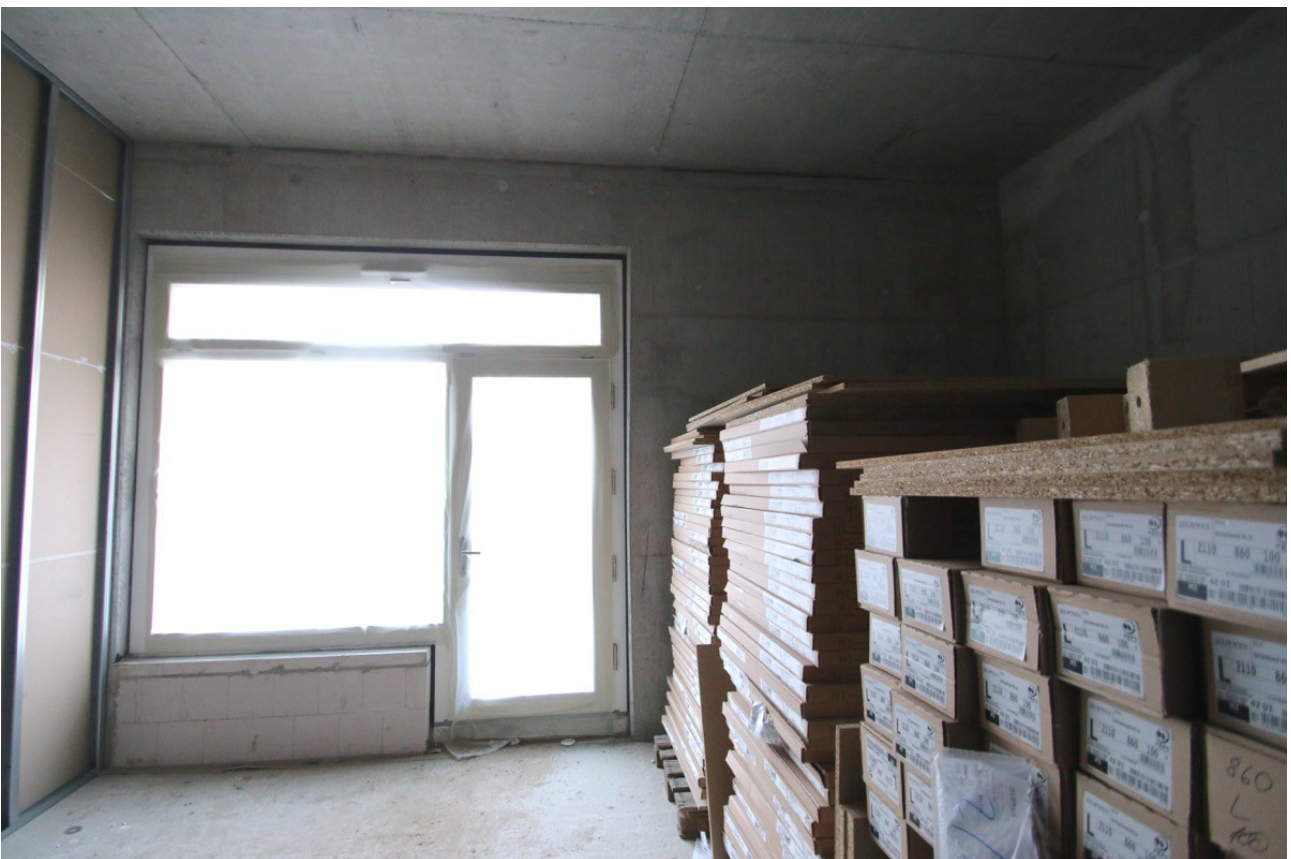
Ladeneingang und Schaufenster