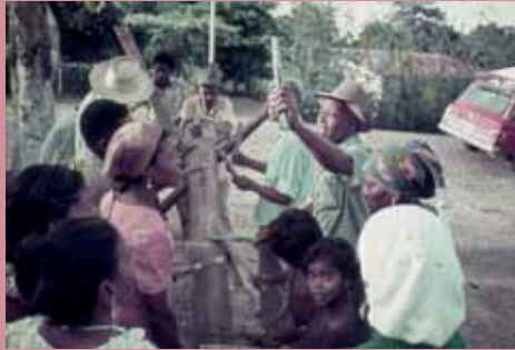
▲ Kinderhook & Caracas: Tocadores del Tambor Mina en Juan Diaz, Barlovento, Venezuela, 1976.