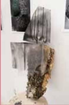
▲ die raum: Gonçalo Sena: Are we not drawn onward to new era? , 2015.