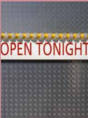
▲ SCHAUFENSTER: Klaus Frahm, Cheap Thrills , 2014