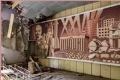
▲ MEINBLAU: „Leninzimmer“ mit Bibliothek / 'Lenin Room' with library, ehemalige Kaserne / Former barracks Forst Zinna, 2014.