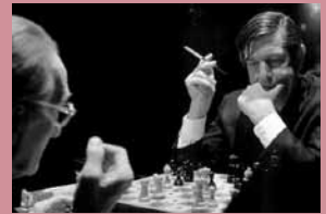
▲ Bublitz: Duchamp und Cage, Réunion , 1968.