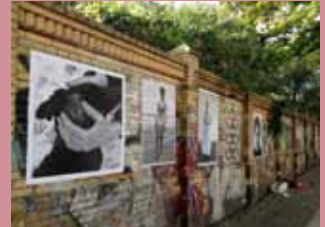
▲ tête: Ausstellungsansicht von KLEISTER 2013, Görlitzer Park