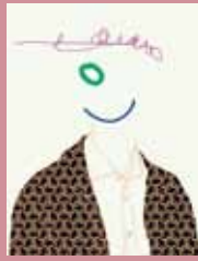
▲ insitu: Aurora Sander, Stammtisch (excerpt) , 2015.